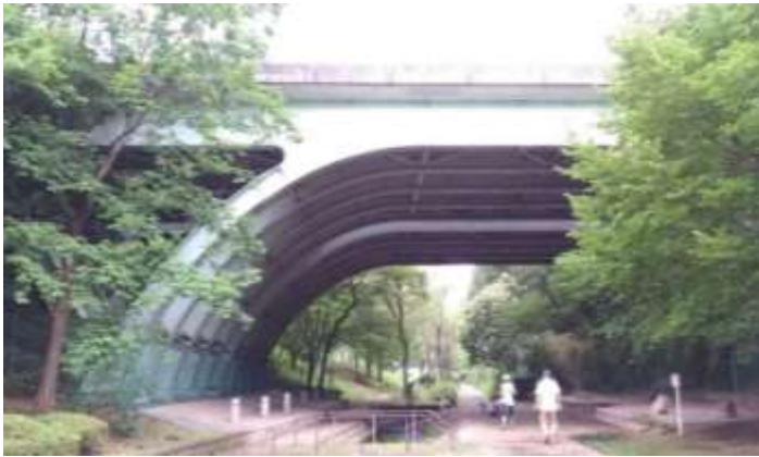
牛久保西と牛久保公園の間 区役所通りの陸橋