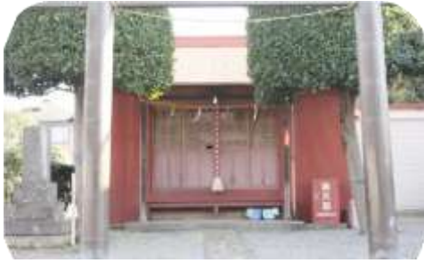
八坂神社・天王様