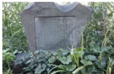
よこはまだけの碑