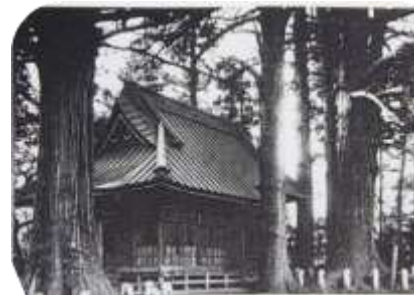
今はなき杉の大木