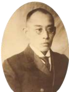
第3代目中山恒三郎