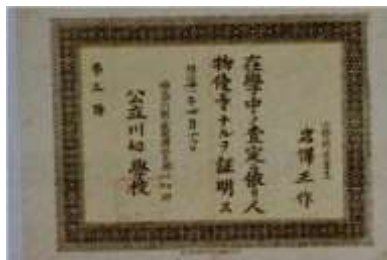
川和学校の成績優秀の証書