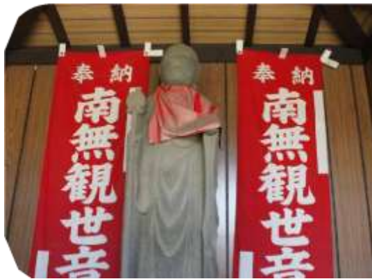
土手にあったお地蔵様