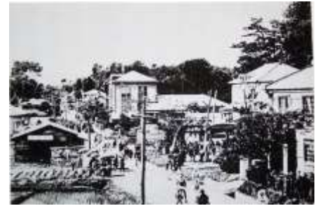
昭和10年頃の川和の町

しかし、明治41年 横浜線が川和町を通らずに 中山町を通るようになり、行政の施設もそちらへ移っていき川和町は寂れてきました。鶴見川と恩田川に二つの鉄橋を架ける必要があり、それを避けたためともいわれています。