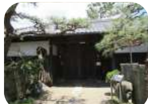
名主家・安藤家長屋門