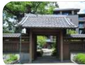
石橋総本家(原家)陣屋門