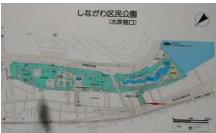
しながわ区民公園と水族館の案内図