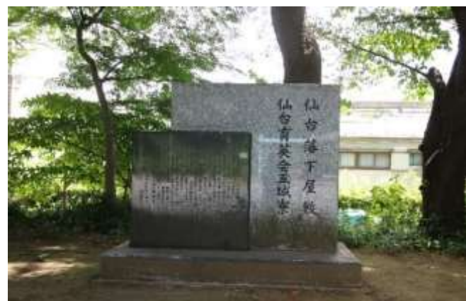
仙台藩の下屋敷跡