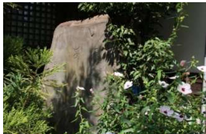
泊船禅寺の芭蕉の句碑

左手が京急鮫洲駅です。右手の運転免許更新の代行屋の横手を入ると鮫洲八幡神社があります。