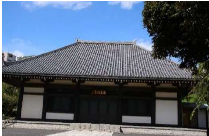
海晏寺 と 岩倉具視のお墓(下)

に 海晏寺 があります。今 NHK の大河ドラマに出ている 岩倉具視の墓所 が小高い奥にあるそうです。