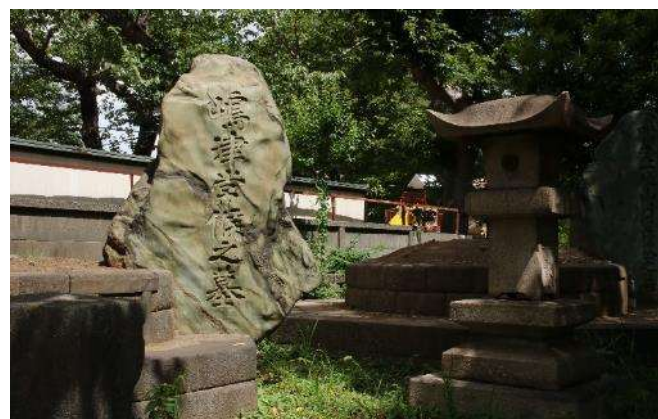
島津家と山内家のお墓が並んでいます

その境内の池に遊ぶコイなどを見て右へ進みます。信号を渡って直進、次の信号の右手に「花街道」の案内が建っています。その右手にコンビニがあるので冷たいものを補給してください。