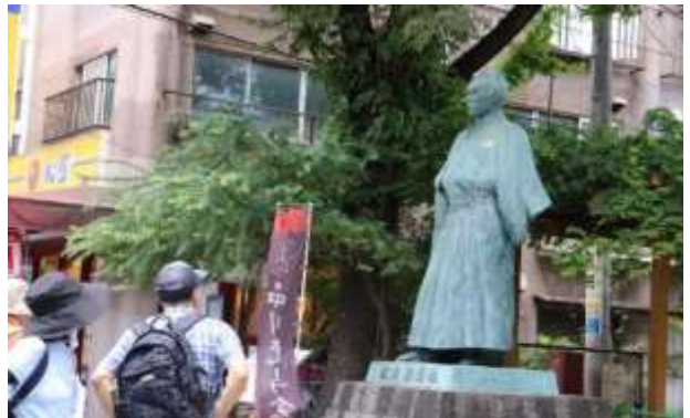
立会川駅側の坂本龍馬像