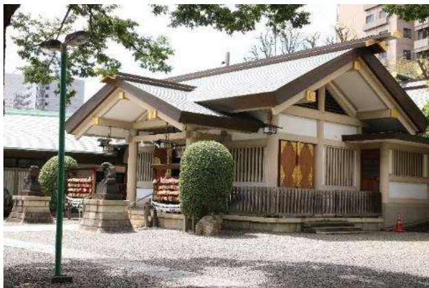
天祖諏訪神社の境内