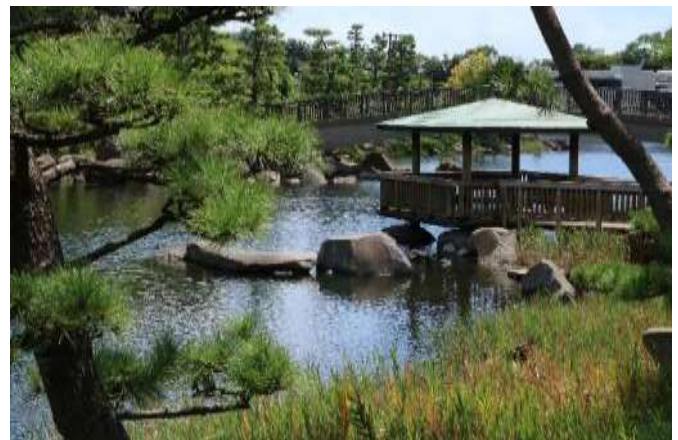
しながわ区民公園の池

一応ここで解散としますが、最寄りの駅は大森海岸駅です。国道沿いに歩いて数分の所です。我慢して横浜で食事をしてOKですね。お疲れさまでした！