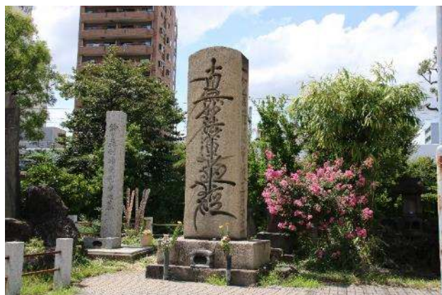
鈴ヶ森刑場跡の碑