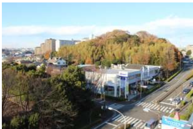
ハウスクエアから見た烏山公園

この小高い丘は、昔家畜の放牧が盛だった頃、牧場主に合図する狼煙(ノ)を焚いたところと伝えられています。昔からの地形と木々を残した自然が豊かな公園です。頂上には家族でお弁当が楽しめるようなテーブルがあります。また、季節には絶滅種に指定されているキンランが群生することもあります。山の北側に中川西地区センターがあります。