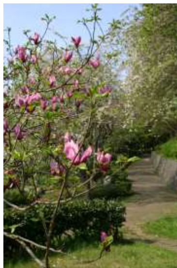
柿の木坂のモクレン