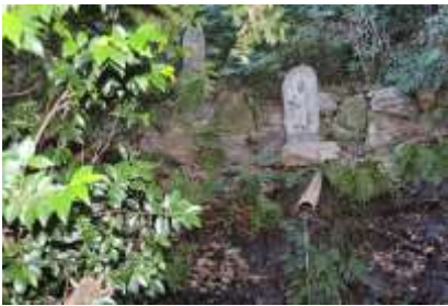
霊泉の滝は今も流れています

霊泉の滝を過ぎて街道を 100m ほど行くと早淵川に出ます。川に沿って 200m 程行くと鍛冶橋があり、橋を渡って 50m 程の所に荏田下宿庚申塔があります。ここは布川との合流点でもあります。ここから川に沿って 300m ほど行くと中荏橋があり、右折すると柚木の交差点にでます。そこを左折して 100m ほどの所を荏田小学校に沿って右折、右手に畑を見ながら 200m 程の所を U ターンするように左折、急坂をのぼります。上りきると左右に畑が広がり、この先の三叉路を右折、またしばらく急坂を上り詰めたところが峠となります。右手に霊園がありますが、東方の眺望は素晴らしく、都筑中央公園からセンター南・北など 180 度のパノラマが楽しめます。後は真っ直ぐに下りです。