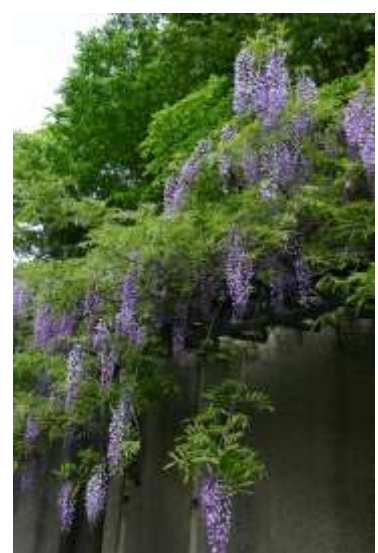
山崎公園の見事な藤棚