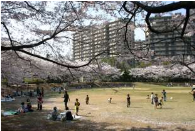
山崎公園の桜に囲まれたグラウンド

港北ニュータウンの中では大規模な公園でプール、池、せせらぎ、運動場に雑木林 竹林や桜も多くグラウンドの周囲を取り巻く桜並木は家族連れで賑わっています。また林には四季折々の花や野鳥が飛来し、カワセミを撮るカメラマンの行列が見られます。西側の東屋がある広場も桜や紅葉などが素晴らしく、柿の木坂には枝垂れ桜やモクレンが咲き乱れます。池の藤棚も見事です。