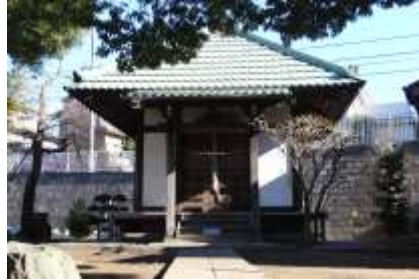
老馬鍛冶山不動尊