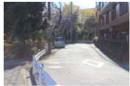
大山街道 下宿付近の現在