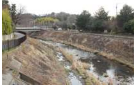
矢先橋付近の早淵川