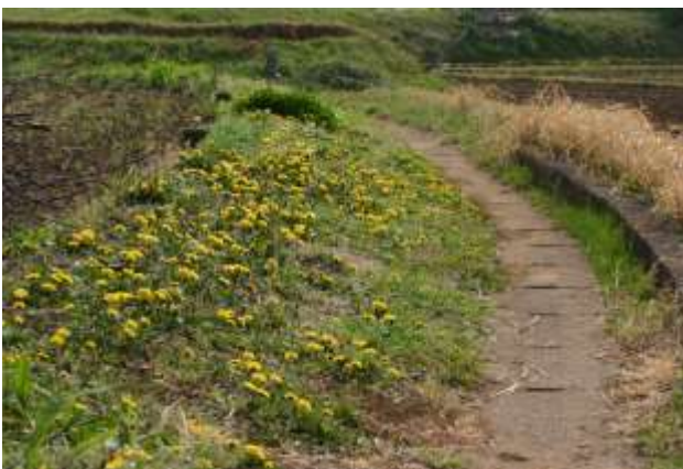
荏田の畑の畦道にタンポポが咲いています