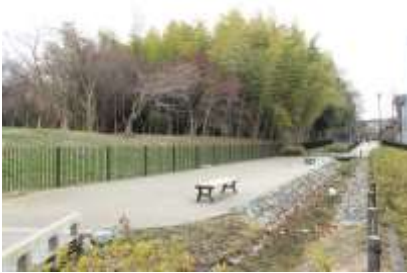
ささぶねの道から早淵川へ

早淵川の神様を祀る小さなお堂が中崎橋の近くに 있습니다。以前、川沿いの水田に水を引くために木製の大堰がありましたが、関東大震災で堰が崩れ、改修されましたが現在は記念銘だけがお堂の脇にひっそりとあります。