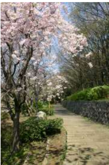
山崎公園の柿の木坂