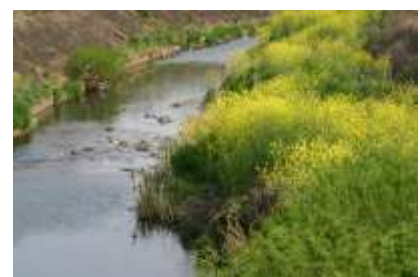
春には菜の花とダイコンソウが