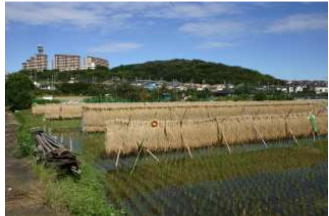
荏田の畑の向こうに山崎公園の山が見渡せます