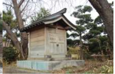
小さなお堂の水神様