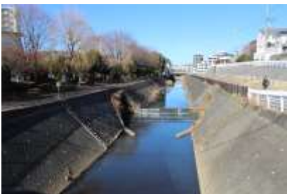
鍛冶橋付近の早淵川

青葉区美しが丘 4 丁目を源流として、都筑区の中央を西から東へと流れ、港北区の綱島で鶴見川に合流する 1 級河川。この川は大雨や台風によってしばしば氾濫し、田畑や橋が流されるほどの被害が繰り返され、特に昭和 42 年の台風 22 号は記録的な被害をもたらしました。これを期に改修工事が行われ現在に至っています。