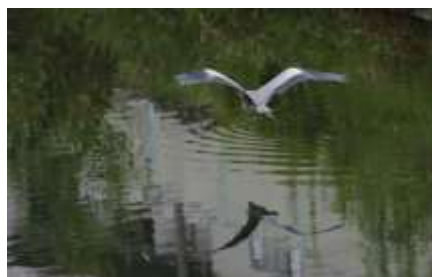
早淵川に運が良いとアオサギが