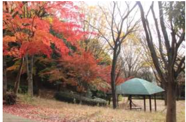
山崎公園の東屋の紅葉