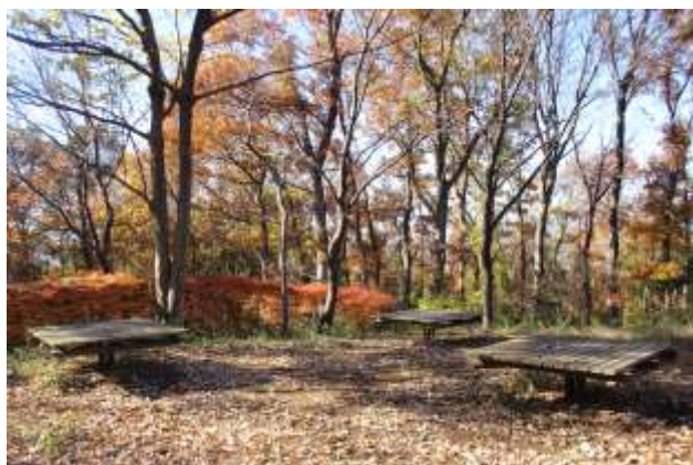
烏山公園 家族と憩いの一時を楽しめます