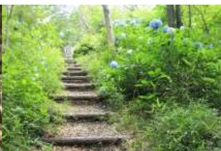
6 月は紫陽花の季節