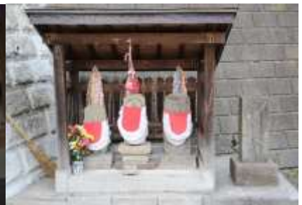
山門脇にある庚申塔

真福寺を出て、少し下り右に曲がります。車の通りの1本裏の道です。突き当たったら細い私道のような道に入ります。民家に沿って登り、下ったところに柚の木の間から出る道に出ます。車を避けるようにして歩き、直ぐに右の急坂を上ってゆきます。登りきったところに桜の木があり、細い道を左折、道に沿って下ってゆくと剣神社の裏手に出ます。Cコースの方はここからさらに上ってゆくと住宅街に出ます。だらだら坂を150mも登ると右手に見晴らしの良い公園があります。その手前を愛和幼稚園の案内板に沿って左折すると右に幼稚園、更に50mも進んで狭い道を右に入れば、すぐに剣神社の裏手に出ます。