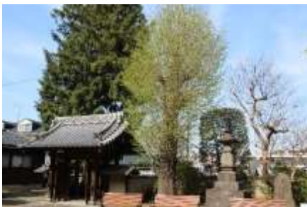
真福寺の山門と大銀杏

現在は昔の宿の面影はありませんが、右折して246号の手前の清水さんのお宅の庭に荏田の秋葉山常夜燈があります。今来た道を少し戻って右に入ります江田駅からくる道を渡り、右手に横浜脳神経外科病院を見て、一つ先を右に入ります。目の前に真福寺があります。ここには国指定の重要文化財の釈迦如来立像があります。