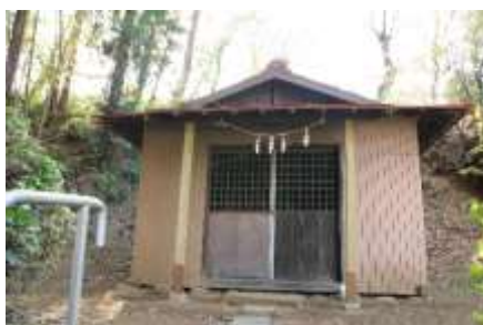
50段の階段の上にある矢羽神社

北から南にかけて一望できるパノラマが展開します。右に都筑メモリアルホールの墓地を見て直進、左側の坂を下らずに歩きます。快適なウォークポイントです。左側に階段が出てきたら、そこを下ります。約90段くらいはありますので気を付けてください。下ったところを直進してゆけばささ道に出ます。蛭見橋を渡って直進。北部病院の脇に出て区役所の前を通り、センター南駅に向かいます。