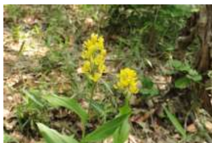
5 月にはキンランが咲き

又は中川の駅前を西に向かい、正面の烏山公園の信号を渡って山の南側の入り口から入ります。入り口には東屋とザリガニのいる池があり、この脇を登ってゆくと、お目当てのキンランに出合います。絶滅種として大事に保護していますので採らないでください！ この山は竹林でも有名で、季節には愛護会が主催してタケノコ狩りが行われています。