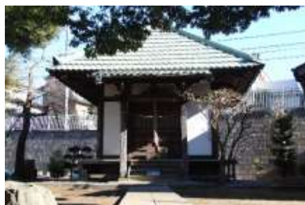
老馬鍛冶山不動尊

山の北側に下り中川西地区センターの前に出たら左に直進します。ゆるやかな坂を下って、突当りを左折（階段は下りません）100mも行くと右手に老馬鍛冶山不動尊の裏手に出ます。その階段を下ると旧大山街道です。少し下ると「霊泉の滝」がちょろちょろと流れています。まったく昔の面影を失くした街道を進むと早淵川に出ます。左に曲がって鍛冶橋を渡ると、すぐ先に荏田下宿の庚申塔があります。