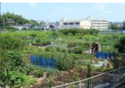
荇田南町の貸し農園と江田小学校