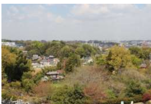
パノラマビューの展望