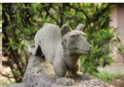
お稲荷さんには変った狛犬が...

矢羽神社に向かうには、パノラマビューの地点から少し戻り、突き当たって右折、一気に山を下って通りに出て左折、すぐに左手に矢羽根神社の道しるべの看板があります。その先の50段の階段を上りきったところに可愛く鎮座しています。見終わったら通りに戻り、矢先橋を通過して早淵川に沿ってみなきたウォークまで出て、右折 センター南に向かいます。