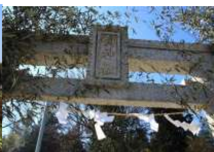
剣神社の正月風景