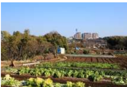
高台の畑からは港北ガーデンが

真福寺を出て、少し下り右に曲がります。車の通りの1本裏の道です。突き当たったら細い私道のような道に入ります。民家に沿って登り、下ったところに柚の木の間から出る道に出ます。車を避けるようにして歩き、直ぐに右の急坂を上ってゆきます。登りきったところに桜の木があり、細い道を左折、道に沿って下ってゆくと剣神社の裏手に出ます。Cコースの方はここからさらに上ってゆくと住宅街に出ます。だらだら坂を150mも登ると右手に見晴らしの良い公園があります。その手前を愛和幼稚園の案内板に沿って左折すると右に幼稚園、更に50mも進んで狭い道を右に入れば、すぐに剣神社の裏手に出ます。