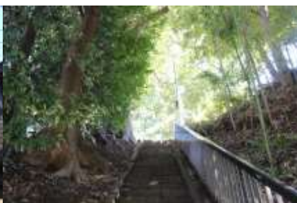
大山街道からの入り口