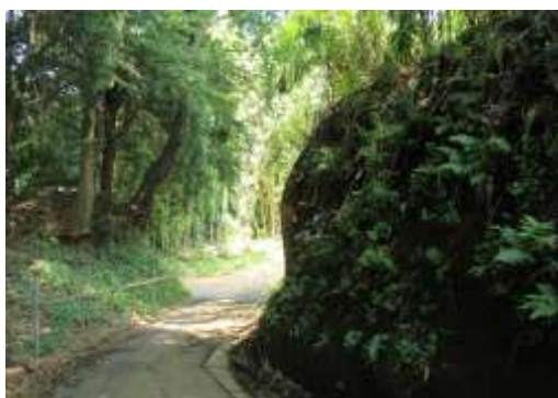
切通しの急坂を登る