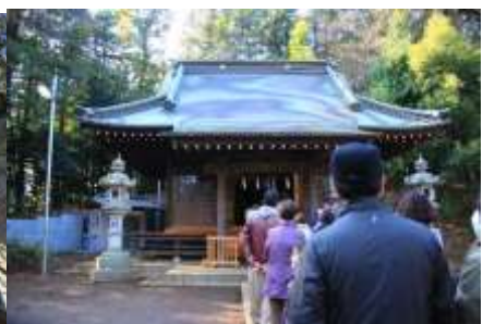
元旦の初詣に集まる人々

正面の石段を下ってバス通りに出ます。(車の通りが激しいので気を付けてください) 左に折れて江田小学校の手前を右折、右に畑を見ながら山裾の道に出ます。ABの方は右に。Cの方は左折して早淵川に出、右折してみなきたウォークの道に出、センター北に向かってください。ABの方は50mも進んでUターンするように左折、急坂を登ります。写真に見るような切通しを登りきると、介護老人ホームの裏手の畑に出ます。80mほど直進して右折。最後の急坂を登りきると、都筑で一番の高所に出ます。