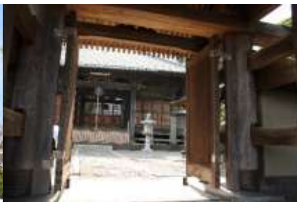
山門より本堂を見る