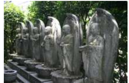
素晴らしいお姿の六地藏達

鎌田堂の前の中原街道を横断歩道で渡り、狭い道を左に曲がりながら入っていくと、長い石段が現れます。竹林の中をゆっくりと登ってゆくと畑が現れ、左手に東山田資料館が現れます。水曜日が開館日ですので中を見学させていただきます。うらの道に出て右手の「そよかぜ公園」の階段を下ると東山田のバスの車庫があります。その先の広い道を右折し、暫らく下ると左手に「観音寺」があります。秋の大銀杏の紅葉は一見の価値はあります。