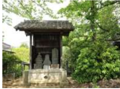
のち目不動の境内