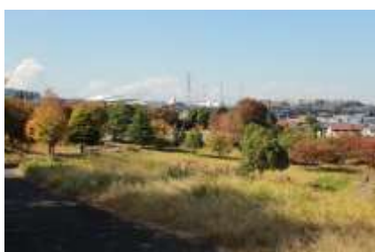
東山田公園からの展望

観音寺を出たら左に曲がり、お寺に沿って左折、緩やかな坂を上り、住宅街を西に向かいます。東山田4丁目から2丁目に入ると左手に「東山田公園」があります。斜面に広がる公園を上ると東山田中学の裏手に出ます。この公園のトップからの眺めは遮るものもなく最高です！北は川崎市方面から西にむけば玉プラザ方面が見渡せます。東山田中学にはコミュニティーハウスがあり、誰でも入れます。トイレもありますので1杯100円のコーヒーを頂きながらの休憩も良いでしょうね。学校を出たら桜並木を西に向かいます。150mも行けば東山田小学校があり、左折して国際プールに到着です。晴れた日には運が良ければ「天空広場」から丹沢の山並みと富士山が望めます。真っすぐに階段を下れば北山田の駅になります。今日は国際プールに沿って右に回り込み竹林の道を下って山田富士公園に入ります。広場の西側にある舞台の前の池には蓮の花が6月末から7月にかけて咲き揃います。公園の右手の山が山田富士です。桜の季節には是非登頂を試みてください。お鉢巡りもできますよ。公園を出て、広い道を横切りオーバブリッジを渡れば北山田駅に到着です。お疲れ様でした。また秋にも再チャレンジしてみてください。素敵な紅葉が待っています。