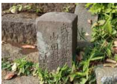
寺内にある山田村の石塔