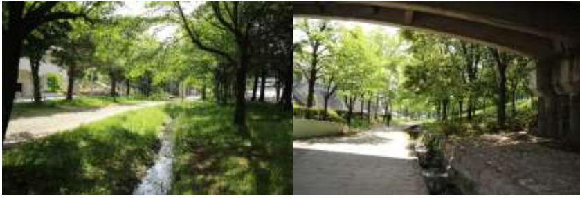
新緑がまぶしいふじやとの道