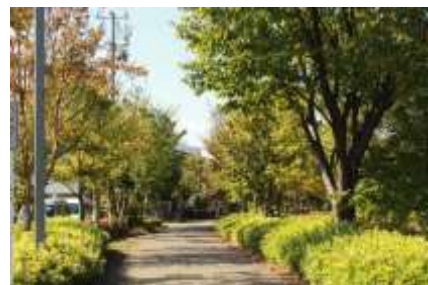
東山田中学裏の遊歩道