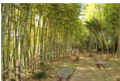
公園に下る竹林の道