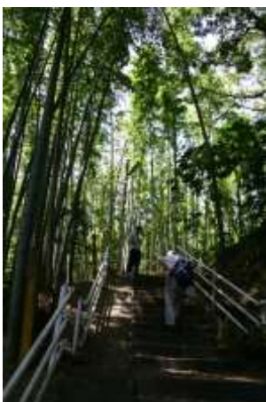
竹林の中の階段を上る

鎌田堂の前の中原街道を横断歩道で渡り、狭い道を左に曲がりながら入っていくと、長い石段が現れます。竹林の中をゆっくりと登ってゆくと畑が現れ、左手に東山田資料館が現れます。水曜日が開館日ですので中を見学させていただきます。うらの道に出て右手の「そよかぜ公園」の階段を下ると東山田のバスの車庫があります。その先の広い道を右折し、暫らく下ると左手に「観音寺」があります。秋の大銀杏の紅葉は一見の価値はあります。