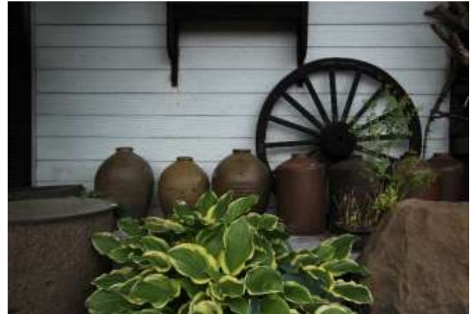
資料館前の展示品