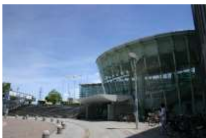
横浜国際プールの展望広場