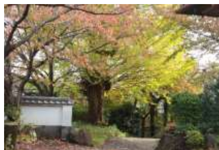
見事な大銀杏の紅葉

観音寺を出たら左に曲がり、お寺に沿って左折、緩やかな坂を上り、住宅街を西に向かいます。東山田4丁目から2丁目に入ると左手に「東山田公園」があります。斜面に広がる公園を上ると東山田中学の裏手に出ます。この公園のトップからの眺めは遮るものもなく最高です！北は川崎市方面から西にむけば玉プラザ方面が見渡せます。東山田中学にはコミュニティーハウスがあり、誰でも入れます。トイレもありますので1杯100円のコーヒーを頂きながらの休憩も良いでしょうね。学校を出たら桜並木を西に向かいます。150mも行けば東山田小学校があり、左折して国際プールに到着です。晴れた日には運が良ければ「天空広場」から丹沢の山並みと富士山が望めます。真っすぐに階段を下れば北山田の駅になります。今日は国際プールに沿って右に回り込み竹林の道を下って山田富士公園に入ります。広場の西側にある舞台の前の池には蓮の花が6月末から7月にかけて咲き揃います。公園の右手の山が山田富士です。桜の季節には是非登頂を試みてください。お鉢巡りもできますよ。公園を出て、広い道を横切りオーバブリッジを渡れば北山田駅に到着です。お疲れ様でした。また秋にも再チャレンジしてみてください。素敵な紅葉が待っています。