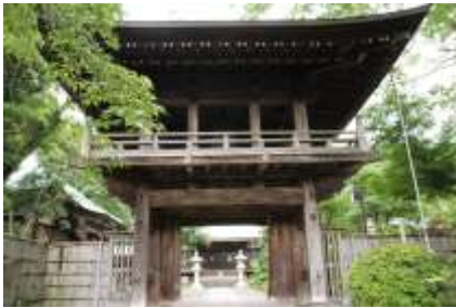
三会寺の二階建て山門