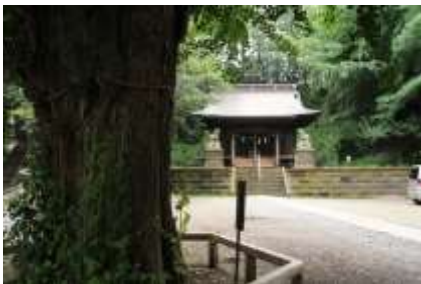
古木の奥に本殿が