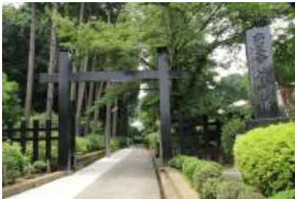
静寂な参道の杉木立

左折して直進、300m余で吉野医院の看板が見えたら右折、突き当たって左折すれば泉谷寺の境内へと導かれます。参道の右手に幼稚園があります。左手の杉木立の前にはアジサイが植えられ、しっとりとした雰囲気を出していました。山門の両側にもアジサイが植栽され、境内にはノーゼンカツラのオレンジ色の花が咲き乱れていました。