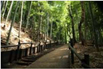
標高は39m程の山です

改札口を出て日産スタジアム側に出ます。横浜線に沿ってスタジアムを右に見ながら進むと、左に踏切が見えますが、ここは帰りにわたります。100mも進むと電柱に 小机市民の森 の案内があり、ここを右折して進めば上り口につきます。だらだら坂を少し上ると、緩やかな階段が続き、直ぐに休憩所（トイレ有）や案内板があります。さらに上ると空堀や土塁のあるところへ出ます。標識に従って二の丸広場へと進みます。大きな木々が迎えてくれます。桜の古木やカエデなどが生い茂り春秋の趣を想像させてくれます。大木は歴史の証人でもあるかのように見えてきます。更に標識に従い本丸へ行きます。市民の森らしくきれいに整備され運動広場のようになっています。