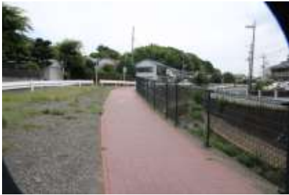
砂田川沿いの遊歩道

橋を渡ってグニャグニャと直進しながらどこまでも下っていくのですが、直ぐに間違いやすいところに出くわします。地図的には左側の点線を進むのですが、右側の細い線上を進むと最後は下り階段になりますが、地図上の点線の道をショートカットする形で鳥山池公園に出ます。ここでは、この公園から左手に進み砂田川に出ます。川に沿って六つ目の橋のところまで川より離れて歩きます。左手の山をまくようにして進み、右手にセブンイレブンをみると、そのすぐ先右側角に馬頭観音堂があります。ここは結構車が通るので気を付けてください。400m程先左手に鳥山観音堂があります。静かな境内で一休みしてください。横浜市指定の立派な名木古木があります。