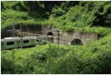
小机城址の下をくぐる横浜線