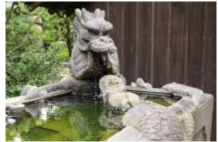
手水鉢には龍が絡みついている

★ショートカット ① 小机駅北口 ⇒ 金剛寺 ⇒ 上麻生線を横切って本法寺に向かう ⇒ なおも直進し砂田川に出ます ⇒ 左手の山すそを回って馬頭観音を右に見て ⇒ 鳥山観音堂から 三会寺 ⇒ 横浜上麻生線に出て西に向かい小机駅を右に見て左に入り ⇒ 雲松院を拝観して 小机駅南口に戻ります。 所要時間は2時間くらいでしょう。