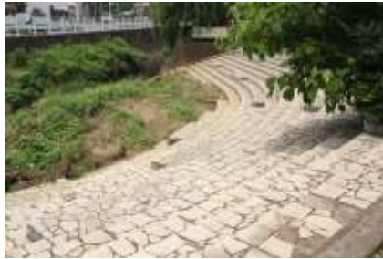
中ほどにイベント広場が