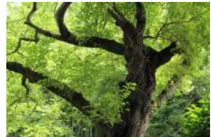
風格のある古木です

もと来た道に戻ります。または標識に従って第三京浜側にも下ることもできます。急な階段がありますが、下りきって右手の第三京浜のトンネルをくぐると左手下に横浜線の線路とトンネル、第三京浜の橋脚も見上げられます。線路に沿って戻り、先ほどの踏切を渡ります。直ぐ右手に美しい土蔵があり、その先に 金剛寺 の入口があります。石段を登ると美しいフォルムの本堂が待っています。7月初旬は白い芙蓉の花が咲いていました。境内のお稲荷さんから東に日産スタジアムが目の前に見えます。階段を下って右に50mも進めば横浜上麻生線の通りに出ます。手前側に郵便局が、反対側に青木歯科があります。右手に第三京浜が見えています。2～300m程度です。（この橋の下の坂道を少し上ると堀崎地藏堂があります）更に300mも進むと泉谷寺の信号があります。ここを左折です。