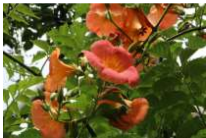
ノーゼンカツラが咲き誇る