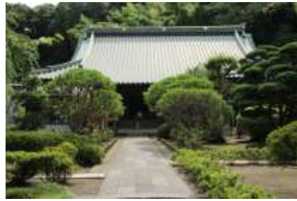
参道の両側は見事な植栽が