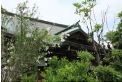
芙蓉が咲く金剛寺