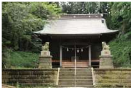
静かなたたずまいの本殿