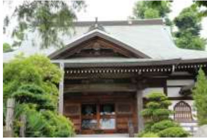
美しいフォルムの本堂