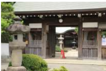
山門より境内を望む