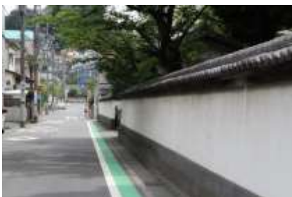
三会寺の美しい白塀

境内を出たら直進して横浜上麻生線に向かいます。街道に出る手前に三会寺があります。美しい白壁に周囲を囲まれています。参拝が終わったら上麻生線に出て左折、小机駅に向かいます。右手に駅舎を見て標識に従って左に入ると雲松院があります。境内に大きな池があり、水連が咲き赤とんぼが飛んでいました。また街道に戻り第三京浜の橋を目指して歩きます。朝方見た青木歯科の手前を左折すると、直ぐに参道に入ります。左手に本法寺の二階建ての山門が見えてきます。二階には鐘楼があります。ここでは珍しい山門と手水鉢を見てください。龍が二体絡みついて水を飲もうとしています。すべて一体の石造りです。見事な技法は市の指定文化財となっています。