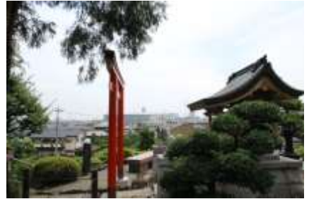
境内から正面にスタジアムが

左折して直進、300m余で吉野医院の看板が見えたら右折、突き当たって左折すれば泉谷寺の境内へと導かれます。参道の右手に幼稚園があります。左手の杉木立の前にはアジサイが植えられ、しっとりとした雰囲気を出していました。山門の両側にもアジサイが植栽され、境内にはノーゼンカツラのオレンジ色の花が咲き乱れていました。