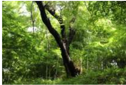
歴史を語る古木たち