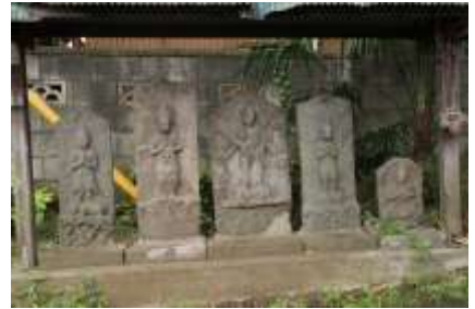
観音堂入口の庚申塔