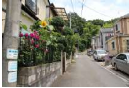
電柱に標識があります