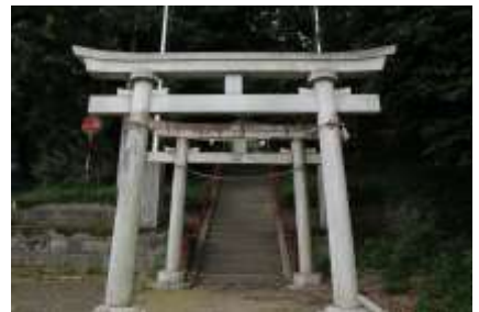
鳥居の奥の階段を上る

境内を出たら直進して横浜上麻生線に向かいます。街道に出る手前に三会寺があります。美しい白壁に周囲を囲まれています。参拝が終わったら上麻生線に出て左折、小机駅に向かいます。右手に駅舎を見て標識に従って左に入ると雲松院があります。境内に大きな池があり、水連が咲き赤とんぼが飛んでいました。また街道に戻り第三京浜の橋を目指して歩きます。朝方見た青木歯科の手前を左折すると、直ぐに参道に入ります。左手に本法寺の二階建ての山門が見えてきます。二階には鐘楼があります。ここでは珍しい山門と手水鉢を見てください。龍が二体絡みついて水を飲もうとしています。すべて一体の石造りです。見事な技法は市の指定文化財となっています。