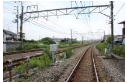
踏切から小机駅が見えます