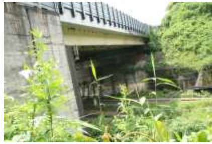
城址を分断した第三京浜