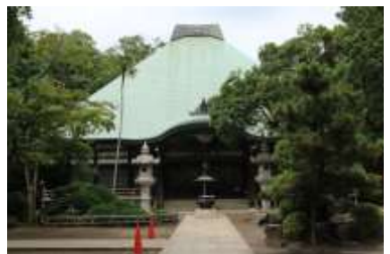
重厚な本堂の作り