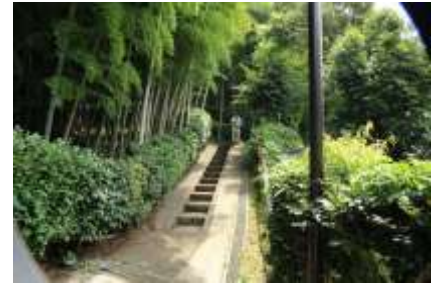
ここから登っていきます

改札口を出て日産スタジアム側に出ます。横浜線に沿ってスタジアムを右に見ながら進むと、左に踏切が見えますが、ここは帰りにわたります。100mも進むと電柱に 小机市民の森 の案内があり、ここを右折して進めば上り口につきます。だらだら坂を少し上ると、緩やかな階段が続き、直ぐに休憩所（トイレ有）や案内板があります。さらに上ると空堀や土塁のあるところへ出ます。標識に従って二の丸広場へと進みます。大きな木々が迎えてくれます。桜の古木やカエデなどが生い茂り春秋の趣を想像させてくれます。大木は歴史の証人でもあるかのように見えてきます。更に標識に従い本丸へ行きます。市民の森らしくきれいに整備され運動広場のようになっています。