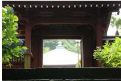
山門の両側にアジサイが