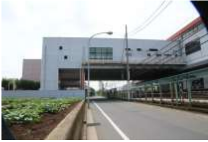
小机駅北口（日産スタジアム側）