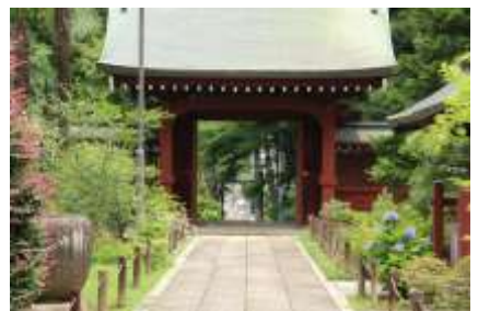
山門より参道を眺める

境内を出たらすぐに右折して、先ほどの上麻生線から分かれた道に出ます。左手に吉野医院の看板が見えます。通りの出たら右折、だらだら坂を左にカーブを切りながら登っていきます。左手に城郷中学校の校舎が見え、さらに運動場を左に見て登りきったところが菅田団地入り口の交差点です。信号を左折して600m近くも進むと左手下に小机第三公園が見えてきます。厄介な交差点が続きますが、本日一番の難所です。構わず直進して第三京浜を跨ぐ土居之谷橋を渡るのですが、分からなくなったら通りがかりの人に聞いて下さい。とにかく分かりにくい場所です。案内看板が是非欲しいところです。