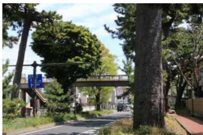
東海道の松並木が続きます