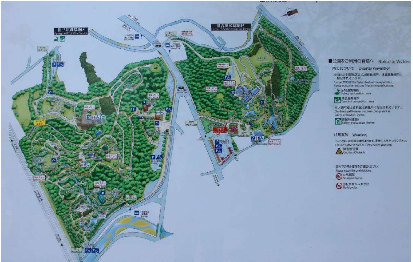
県立城山公園散策マップ