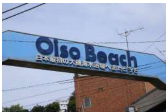
ようこそ大磯へのアーチ