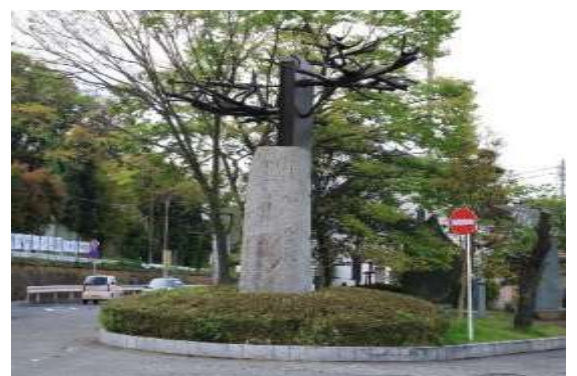
湘南発祥の地の碑