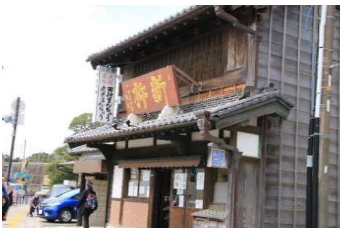
お饅頭の老舗「杵新」

また戻りますが国道にでる一つ手前の路地を左に入りましょう。様々な別荘があったであろう小道を歩いて国道に出ます。直ぐに「湘南発祥の地」の碑があり、その先の「鳴立庵(しぎたつあん)」は京都の落柿舎、滋賀の無名庵に並ぶ俳句の道場です。入場料300円を払って中にある建物を見る価値はありそうです。