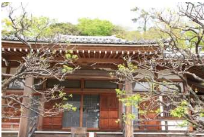
島崎藤村の眠る地福寺