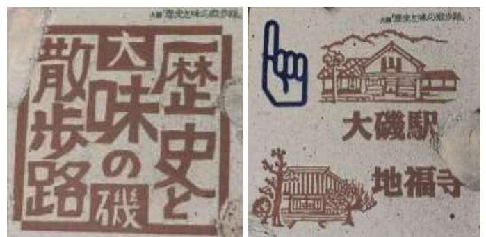
道路にはめ込まれたタイル

その少し先の消防署前の信号の所で右側の路地に入ります。道には楽しい絵タイルが張り込められています。その先に「地福寺」があります。中に入ると梅の老木に囲まれるようにして島崎藤村の眠る墓があります。