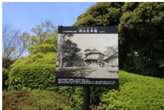
展望台にある城山荘本館の図