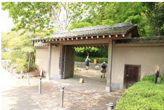
西門から入ってみましょう