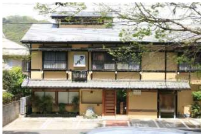
街道にあるお蕎麦屋さん