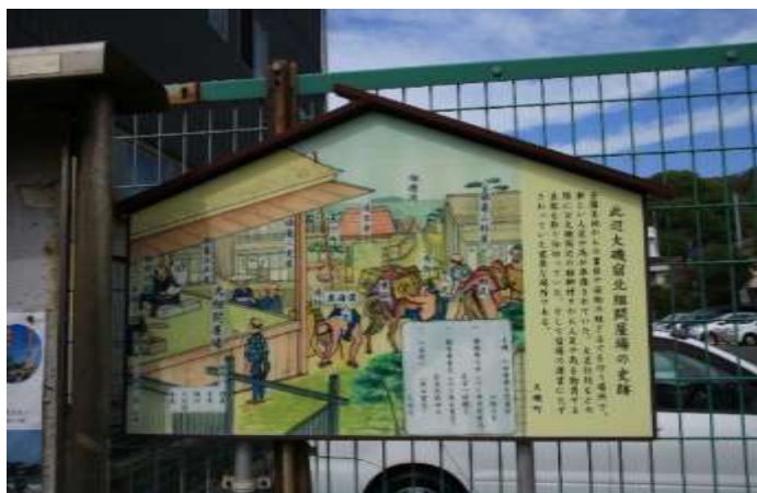
大磯北組問屋場跡の説明版