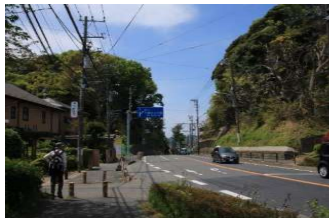
城山公園の切通し