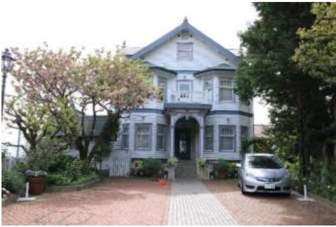
レストラン大磯迎賓館