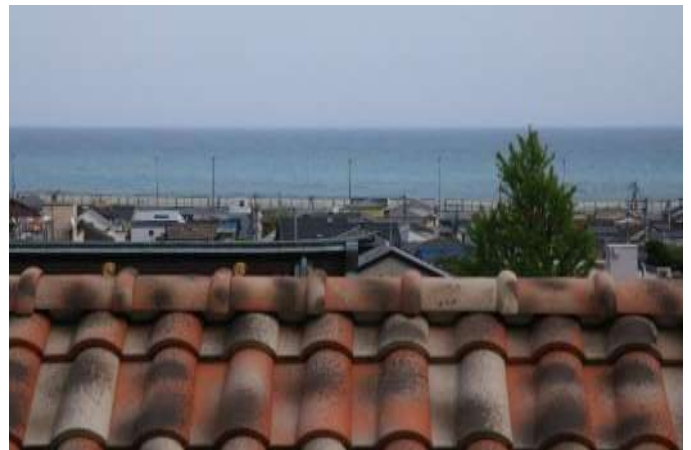
貿易商であった木下家の別荘-迎賓館として使用