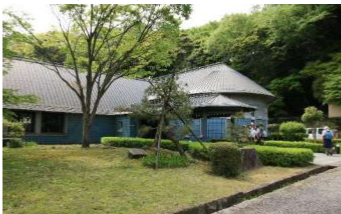
大磯町郷土資料館

コース：大磯駅—大磯迎賓館—延台寺—大磯問屋場史跡—地福寺—新島襄終焉の碑—原敬別荘跡—鷗立庵—別荘群の小道散策—大磯町役場—島崎藤村邸—松並木—大熊重信邸跡—伊藤博文邸跡(滄浪閣)—西園寺邸跡—八坂神社—城山公園切通し—吉田茂別荘-昼食後解散- 城山公園前バス停より大磯駅へ(直線距離 2.5km)