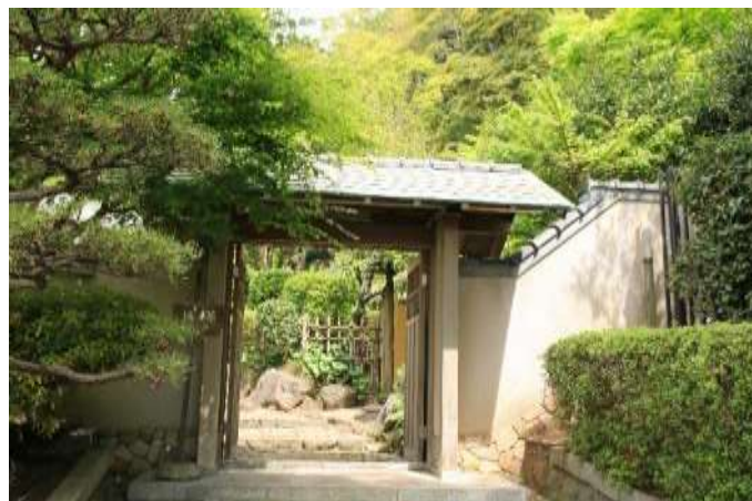
園内の茶室「城山庵」