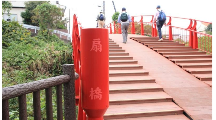
イタチ川を渡る扇橋