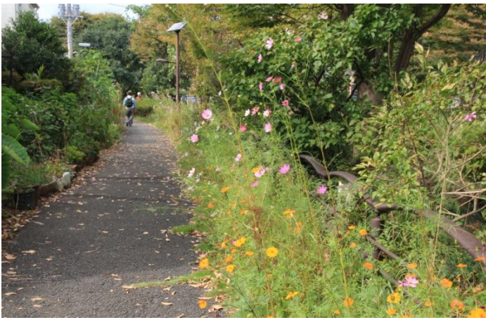
イタチ川沿いの遊歩道