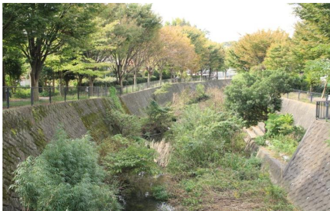
日東橋付近のイタチ川