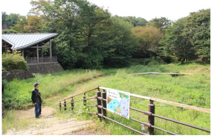
青葉橋付近の公園