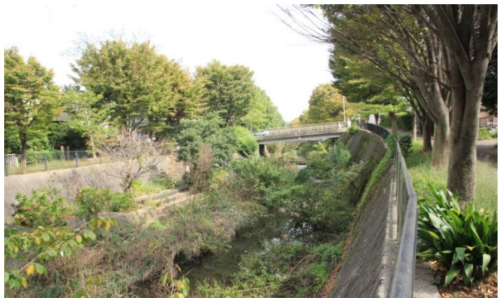
桂橋付近のイタチ川

C班は公園に入らず日東橋を渡り川に沿って直進してください。そして桂橋で広い道を横切りなおも直進して上耕地橋を過ぎれば直ぐに天神橋に到着します。信号（環状4号線）を渡って反対側のバス停から上大岡に戻ります。お疲れさまでした。下見では13,000歩、2時間半の行程でした。