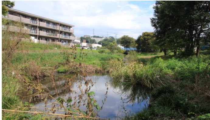
辺淵橋付近のイタチ川