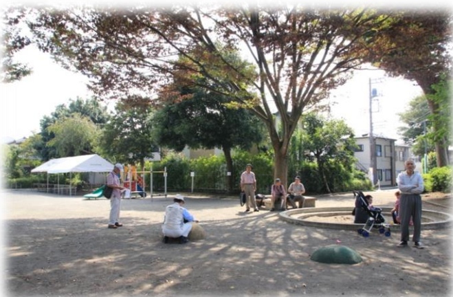
上飯田けやき公園で小休止