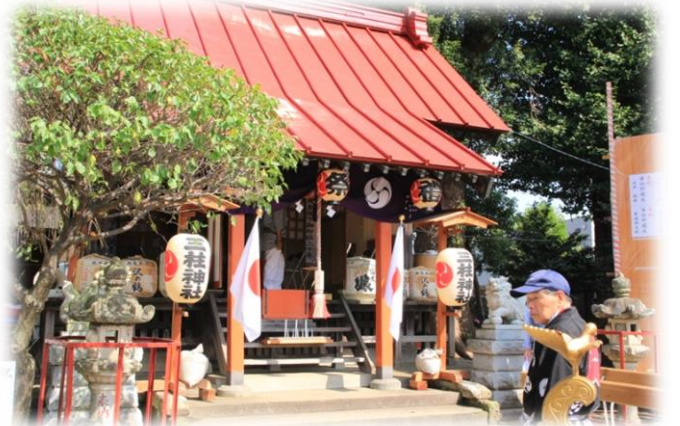
三柱神社の祭礼の日（10月2日）