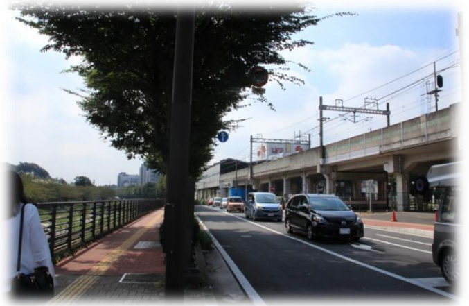
相鉄線いすみ中央駅