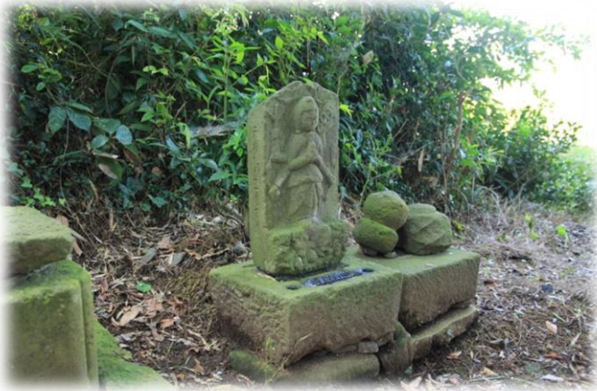
鎮守の社の庚申塔

公園を出ると目の前の可愛い道が・・・昔の 大山街道 です。その道を進むと 長後街道（厚木街道） に出ます。右へ街道にそって直進相鉄線いずみ中央駅に出ます。C班はここで終了です。お疲れさまでした。AB班はもう少し頑張りましょう。