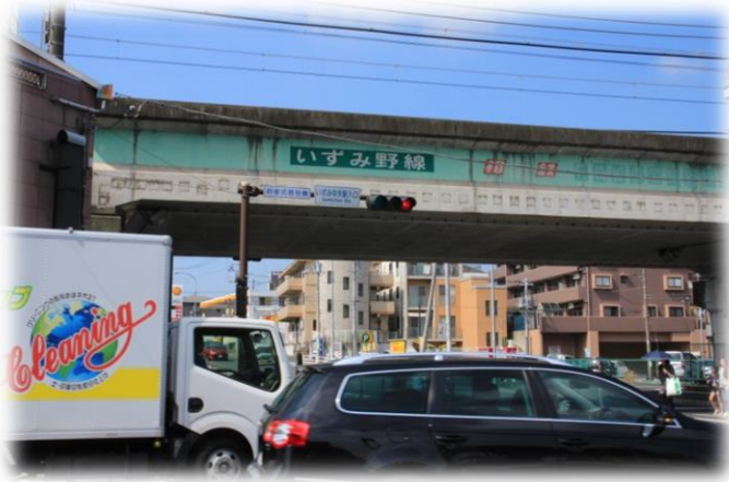
厚木街道をまたぐ相鉄いすみ野線