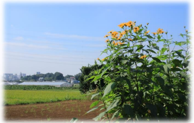
のどかな田園風景の中を進む