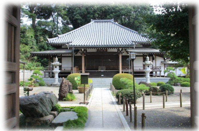
長福寺（上）と宝心寺（下）

突き当たって右折、左手に代官屋敷があります。さらに左右に立派な民家を見ながら軽い坂を上り、右に下り左折、上の道の下をくぐって直進、突き当りを右へ下ります。三叉路の左手に四ツ谷石仏群をみて右折、右手の畑の先に相鉄線が見えてきます。そして「草木橋」で和泉川を渡り左折、川沿いの遊歩道を進みます。すぐに「右へ300mで下飯田駅」の看板がありますのでそこを右折、坂を上った先で街道を信号で渡ると目の前に下飯田駅が現れます。