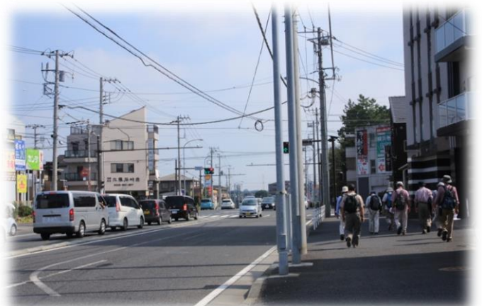
厚木街道（長後街道）からいずみ中央駅へ

相鉄のガードをくぐり直進、泉区中央4丁目の信号で右折、すぐ左手に 蚕御霊神塔 があります。直進して駅舎を正面に見て手前の道を左折、 須賀神社 を経て 長福寺 に入ります。その先に 泉小次郎馬洗いの池 があり、その裏手の 泉中央公園 を回って右に下ります。突き当たって向かい側の駐車場を横切って川沿いの道を右に、 和泉川 にかかる「 石橋 」を渡って直進、左手に 桜川公園 を見て進みT字路を左折、道なりに進むと右手に 中之宮佐馬神社 が現れます。ここで小休止をして和泉川に戻り「 御蔵橋 」の手前を右へ、「 閑鳥橋 」で車道に出て進むと直ぐ右手に 宝心寺 が、境内には大きな イトヒバの大木 があります。もと来た道に戻り先ほどの橋を渡って直進。畑の中にカカシが3体・・・