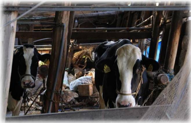
坂道の途中に牛舎が