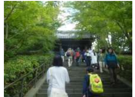
円覚寺の山門への階段