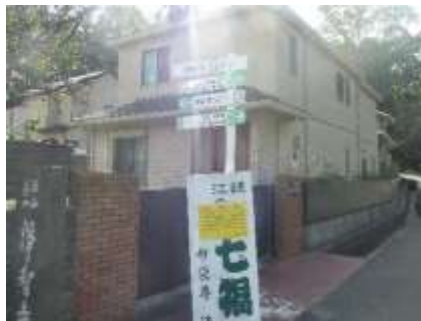
浄智寺入口の案内立て札