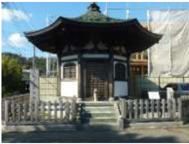
海蔵寺の岩船地蔵

亀ヶ谷切通しを道なり下るとT字路に突き当たり右手に「海蔵寺の岩船地蔵」があります。そこを右折し、横須賀線のガードをくぐり、道なりに真っ直ぐ進みます。300メートルぐらい進むと海蔵寺の石段が見えます。そこが海蔵寺です。