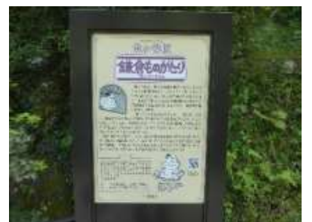
亀ヶ谷切通しの説明板