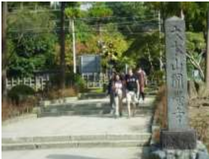
円覚寺の参道入口

JR横須賀線北鎌倉駅西口を出て左折します。今回は、円覚寺の正しい入り方として、横須賀線の線路を越えた「二つの池の真ん中の参道」から入ります。拝観料300円をご用意ください。 (横須賀線を敷設するときに、円覚寺の参道を線路が横断した)