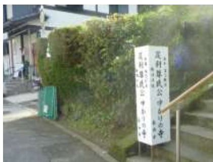
足利尊氏公ゆかりの寺 長寿寺