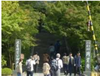
線路を渡ったところ 北条時宗墓所の記