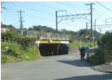
横須賀線のガード

海蔵寺を出て来た道に戻ります。横須賀線のガードの手前を右折し、線路沿いを進みます。途中で、稲荷大明神を右手に見てそのまま真っ直ぐに進みます。300メートルぐらい進むと右手に、「白い壁」が見えてきます。そこが英勝寺です。拝観料 300 円をご用意ください。