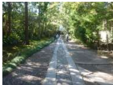
寿福寺の美しい石畳の参道