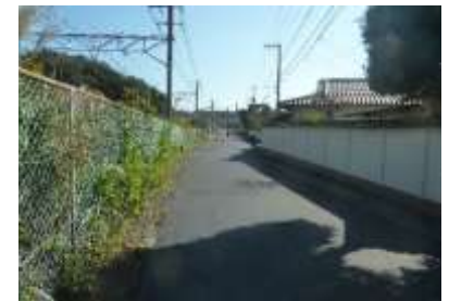
右側の白い壁が英勝寺