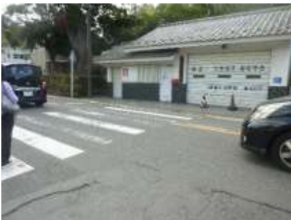
円覚寺の参道を出て横断歩道

円覚寺の参道入口まで戻り、横断歩道を渡ります。途中に東慶寺の案内板を取りすぎ、「浄智寺の入口を表す標と七福神布袋様の立て札」の所を右折し道なりに50メートルぐらいで石の橋が見えます。そこが浄智寺の入口です。拝観料200円をご用意ください。