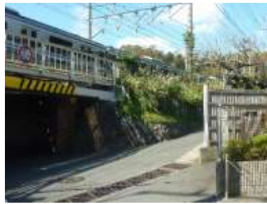
横須賀線のガード