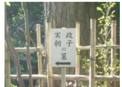
北条政子と源実朝の墓所へ