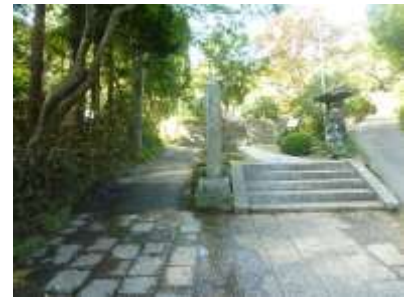
海蔵寺の入口の石段