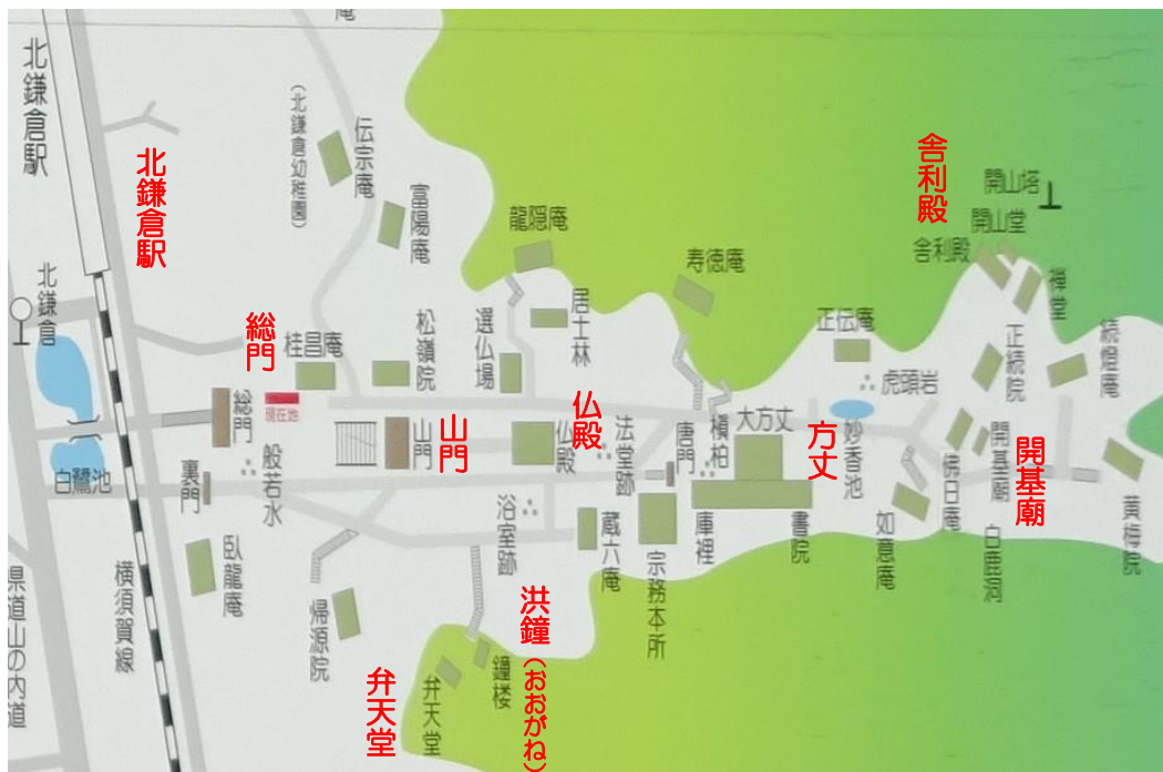
線路を渡った所 元寇の役 北条時宗墓所の記