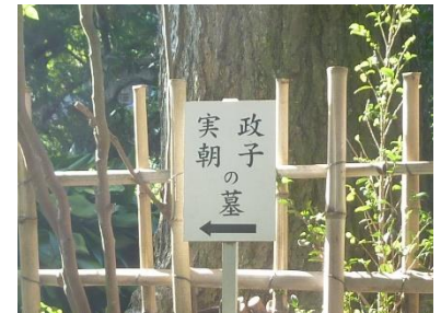
北条政子と源実朝の墓所へ