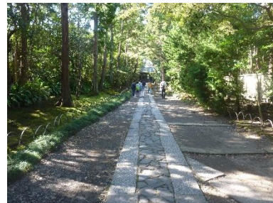
寿福寺の美しい石畳の参道