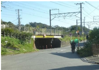
横須賀線のガード

海蔵寺を出て来た道に戻ります。横須賀線のガードの手前を右折し、線路沿いを進みます。途中で、稲荷大明神を右手に見てそのまま真っ直ぐに進みます。400メートルぐらい進むと右手に、寿福寺の山門が見えてきます。そこが寿福寺です。