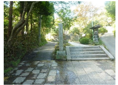
海蔵寺の入口の石段