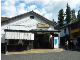
北鎌倉駅西口改札 を出て 右側に集合