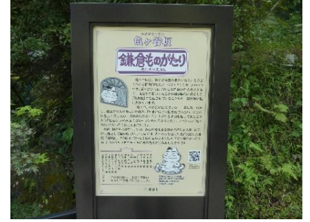
亀ヶ谷坂切通しの説明板