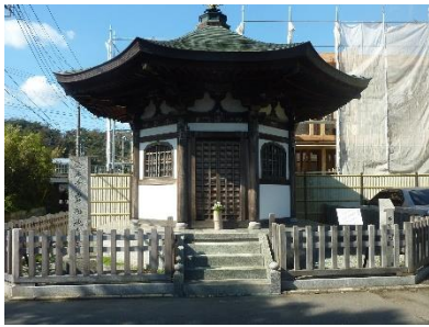
海蔵寺の岩船地蔵

亀ヶ谷坂切通しを道なり下るとT字路に突き当たり右手に「海蔵寺の岩船地蔵」があります。そこを右折し、横須賀線のガードをくぐり、道なりに真っ直ぐ進みます。300メートルぐらい進むと海蔵寺の石段が見えます。そこが海蔵寺です。