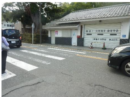
円覚寺の参道を出て横断歩道

円覚寺の参道入口まで戻り、横断歩道を渡ります。途中に東慶寺の案内板を取りすぎ、「浄智寺の入口を表す標と七福神布袋様の立て札」の所を右折し道なりに50メートルぐらいで石の橋が見えます。そこが浄智寺の入口です。拝観料200円をご用意ください。