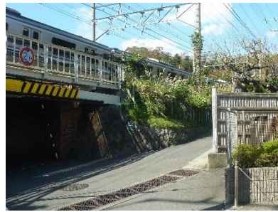
横須賀線のガード