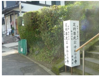
足利尊氏公ゆかりの寺 長寿寺