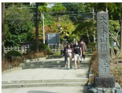
円覚寺の参道入口

JR横須賀線北鎌倉駅西口を出て左折します。今回は、円覚寺の正しい入り方として、横須賀線の線路を越えた「二つの池の真ん中の参道」から入ります。拝観料500円をご用意ください。円覚寺の総門をくぐり、山門・仏殿・開基廟、国宝の舍利殿・洪鐘など見所多くあります。