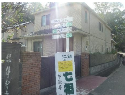
浄智寺入口の案内立て札