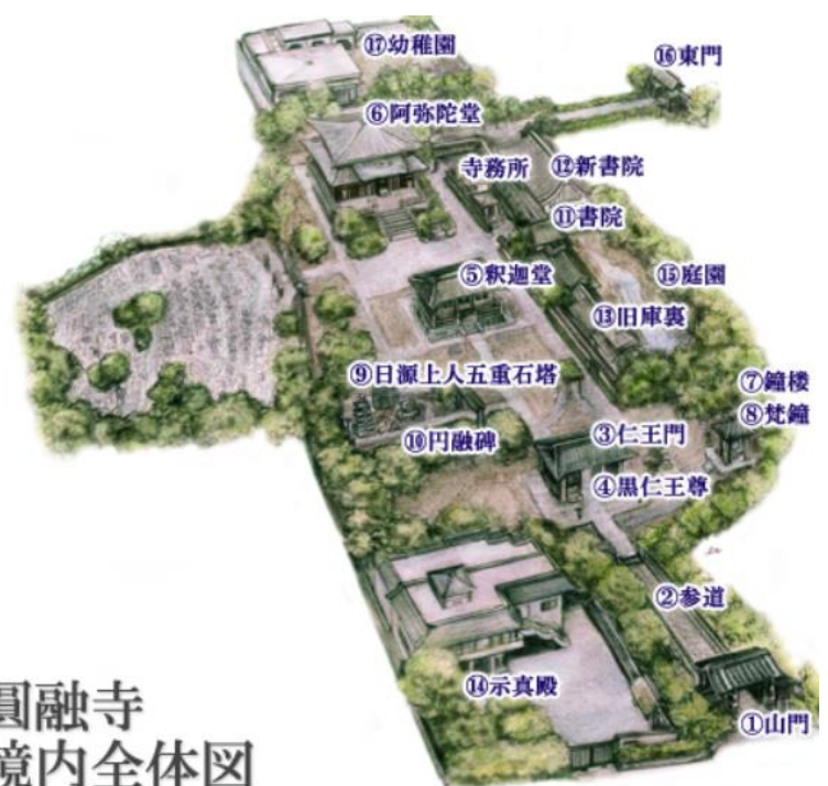
圓融寺 境内全体図