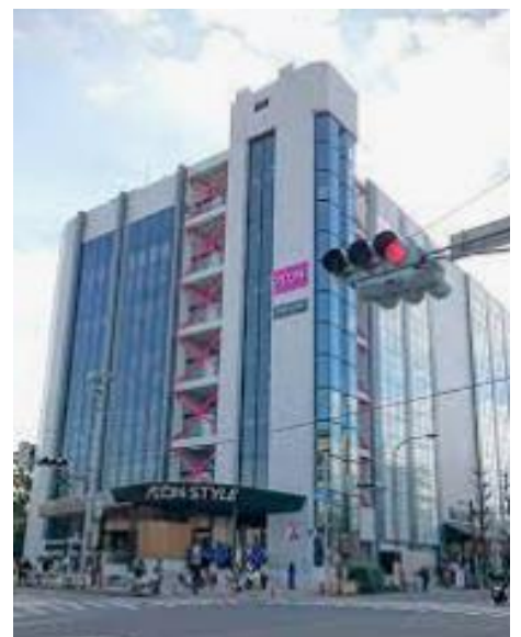
イオンスタイル碑文谷

目黒通の交差点に「AEON スタイル碑文谷 7階建て」がある。1975年からダイエーの旗艦店だったが、41年後の2016年にはイオンに変わっています。(1980年代は取材などでTVにも良く映っていたのですが)