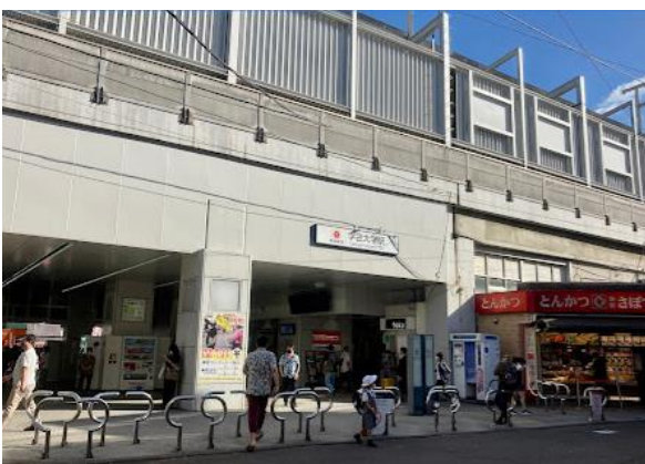
東横線 学芸大学駅