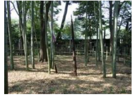
すずめのお宿 緑地公園 昭和 56 年開園 7500㎡

竹林やシイ・ケヤキの大木が残り、野鳥が多く生息しています。なお北側の一角に栗山家の母屋(目黒区指定有形文化財)が 復元されています。