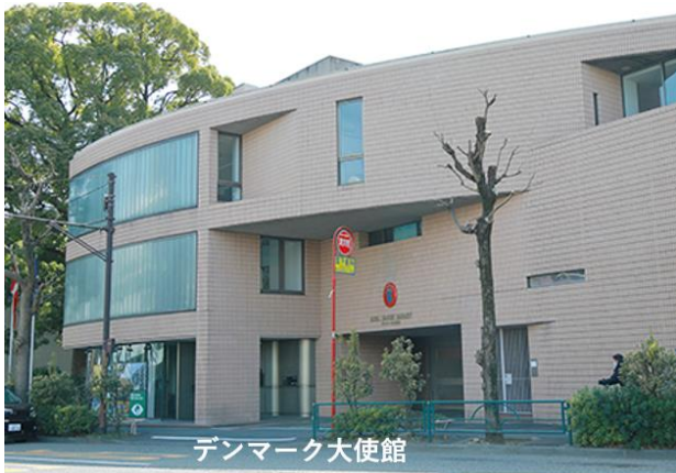
デンマーク大使館