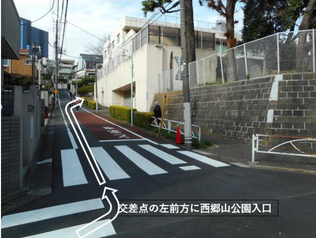
交差点の左前方に西郷山公園入口