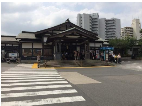
高尾駅北口 左側にトイレあり