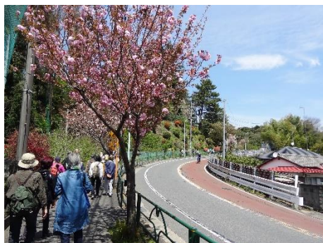
森林総合研究所経向かう途中