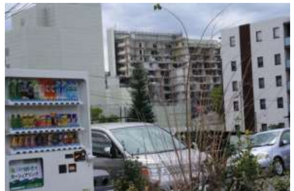
問題があったマンション⇒解体中