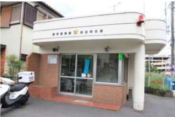
バス停近くの交番

墓があります。そしてその先の少し上ったところに観音寺があります。C班の方は阿弥陀堂より下方に臨まれる横浜上麻生線に下ってください。直ぐにバス停が見つかります。川和・中山方面行のバスに乗車できます。A/B班の方はららぽーとまで行き、食事などをしながらセンター南、仲町台方面にお帰りください。